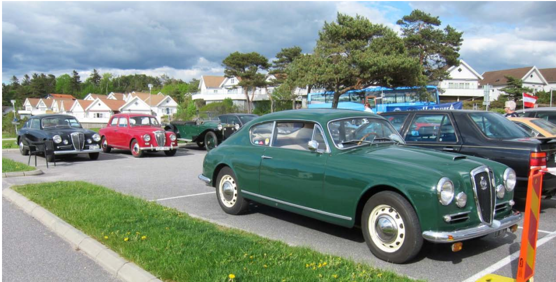
Från Svenska Lanciaklubbens internationella 60-års.jubiläumsträff i Tanumstrand, maj 2013