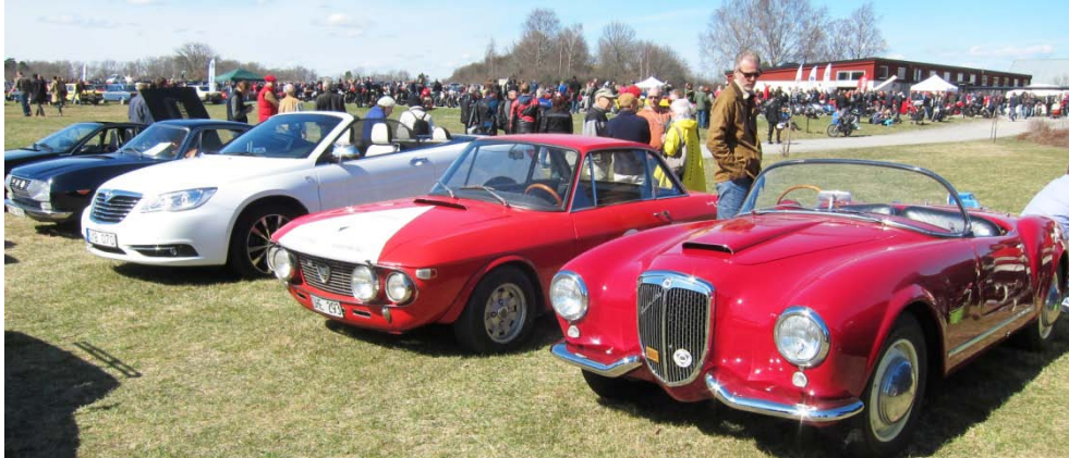
Lancia Aurelia B24 Spider, Fulvior och en vit nytillverkad Lancia Flavia Cabriolet.