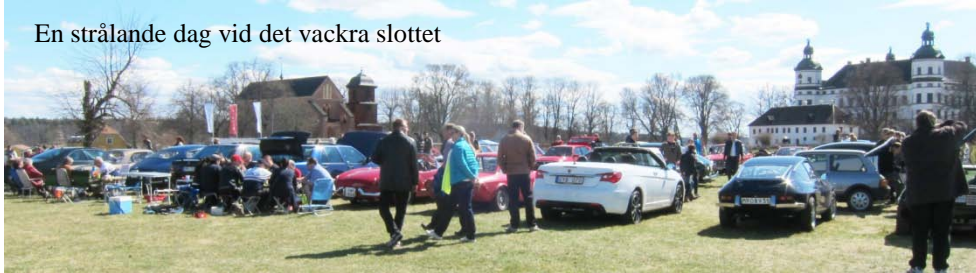
En strålande dag vid det vackra slottet