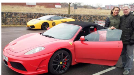
Magnus fyllde ju 50 år också.