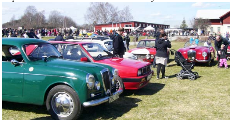
Såväl Fiat som Lancia och Alfa Romeo hade dukat upp för försäljning inomhus, medan Lanciaklubbens rikhaltiga modellsortiment radades upp utanför.