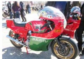
Italienska motorcyklar så långt ögat når. Och så klart hela fältet fullt med Alfor, Fiat, Ferrari m.fl. italienskt.