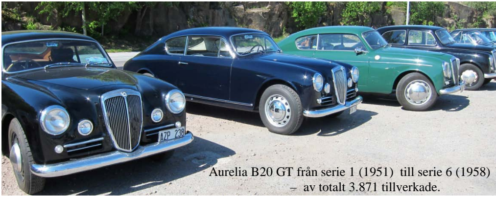
Aurelia B20 GT från serie 1 (1951) till serie 6 (1958) – av totalt 3.871 tillverkade.