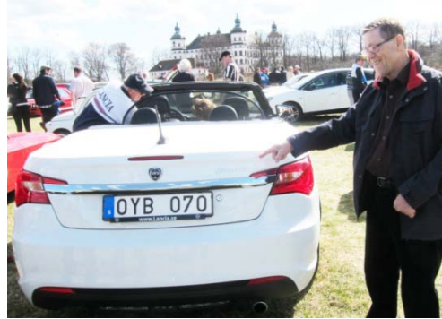
En alldeles ny Lancia ! Vacker och komfortabel – men vad står det på märket ? Jo minsann – Flavia ! En återanvändning av den gamla fina 60-talsmodellen.