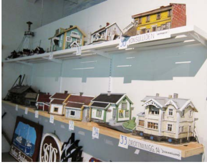
I ett rum jobbades med fina handsnidade träskyltar till båtar och hus m.m.