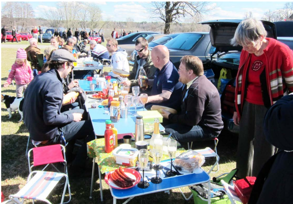
Familjefest med grillat och italiensk bubbeldryck – långbord behövs.