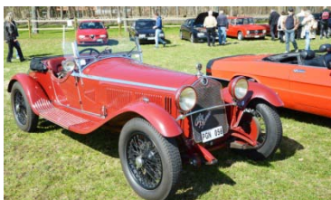
Rara italienska Alfor minsann. Minstingen i Fiat-familjen.