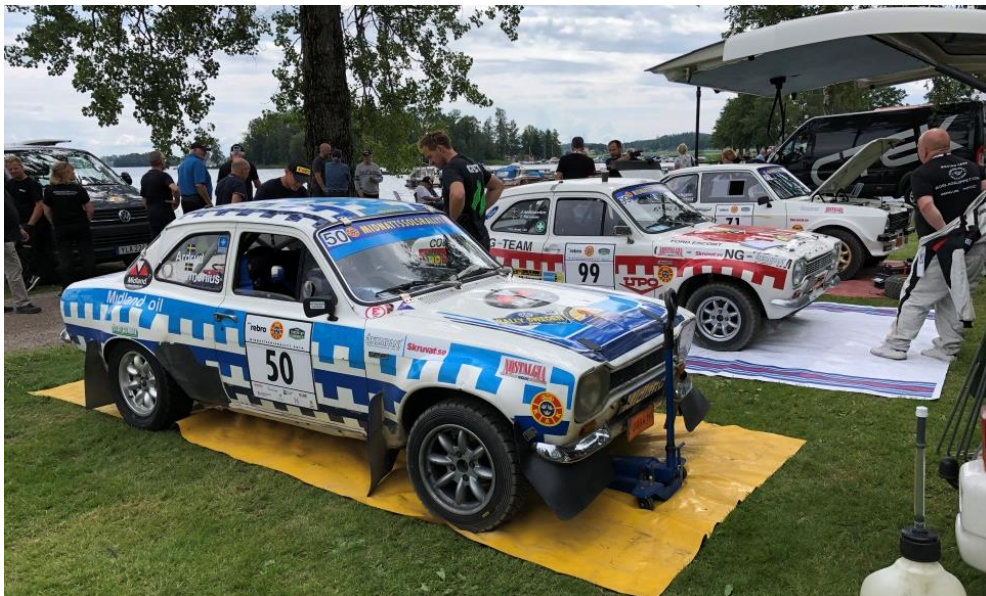
Bild: Flera Ford Escort uppradade för service i Rallydepån.

På sträckan före matuppehållet åker vi för fort in i en tvär vänstersväng. Vi sladdar av vägen och närmar oss flera stora träd, men med full gas på tvåans växel så driver bilen tillbaka upp på vägen igen, och vi passerar målskyltarna, som satt alldeles efter den tvära svängen. Vi pustar ut och konstaterar att detta var ett ”big moment” igen.