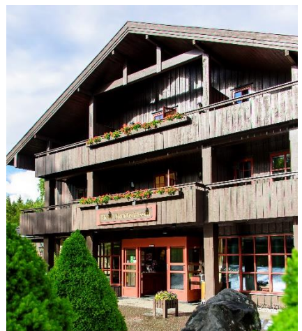
Hunderfossen hotel & resort